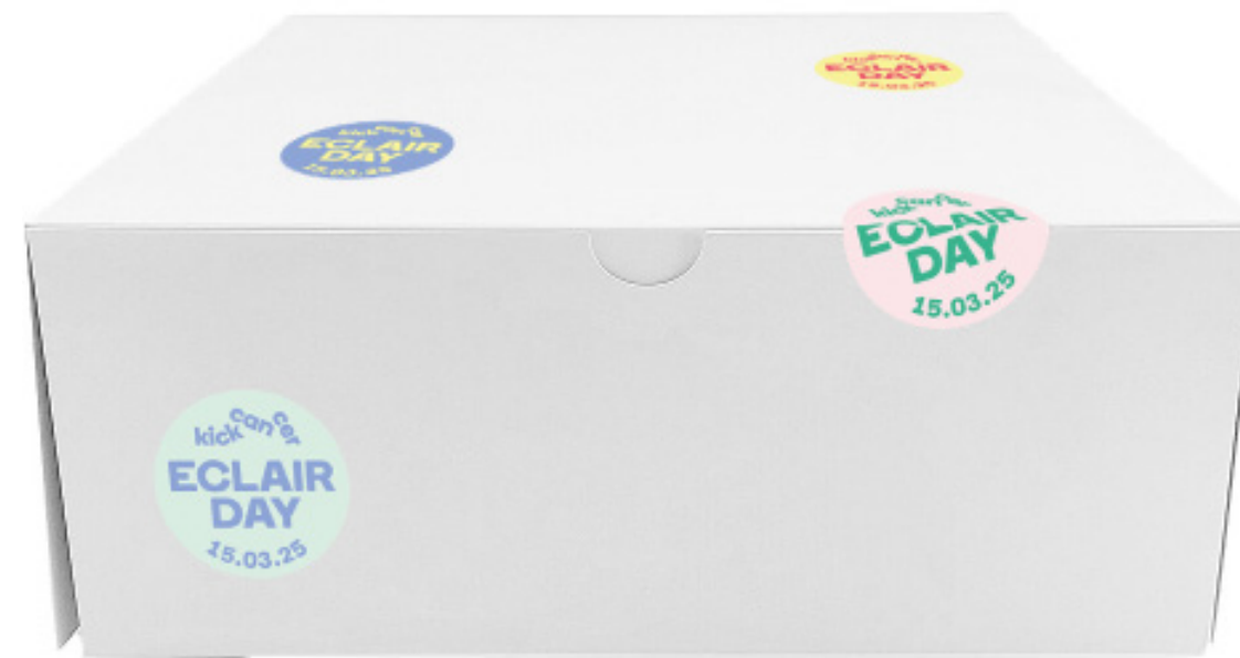
Petits autocollants pour les boîtes